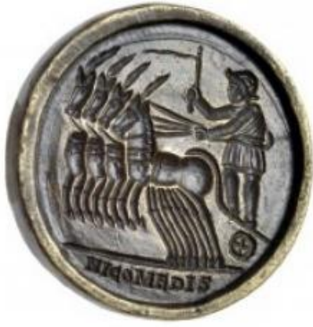
Abb. 27: Medaillon (Kontorniat) mit Rennfahrer (GDKE, Rheinisches Landesmuseum Trier, Foto @ Th. Zühmer) – In der Ausstellung im RLM zu sehen.